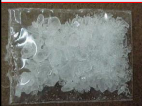
Tinh thể (ma túy đá)